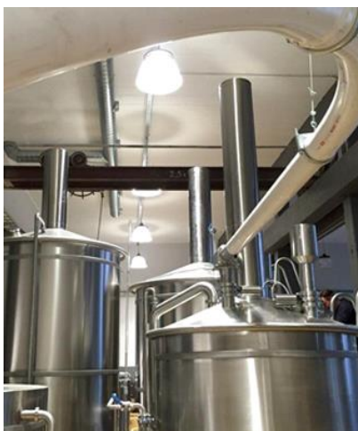
FLECKS Craftbier Brauerei 3-5-10-20-30-50 HL