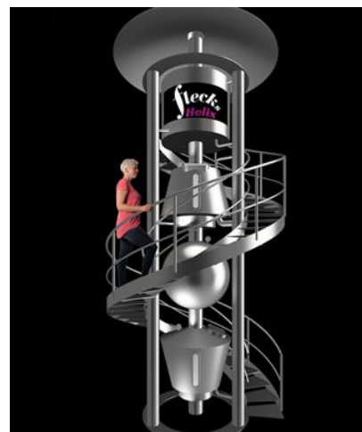
FLECKS HELIX Brau-Turm 5 HL

Bauen Sie sich Ihre komplette Brauerei mit Hilfe unserer Module selbst zusammen: