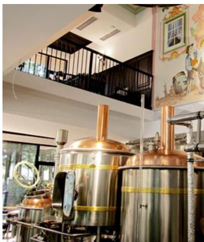
FLECKS klassische Gasthausbrauerei 3-5-10-20 HL